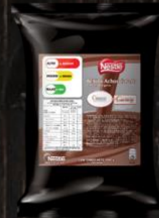
Nestlé Savoy Bebida Achocolatada