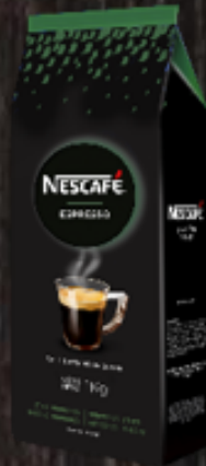
Café en grano