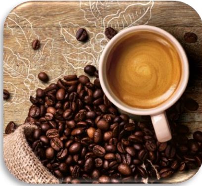
EFICIENCIA EN PREPARACIÓN