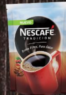
Café Soluble Nescafé Tradición